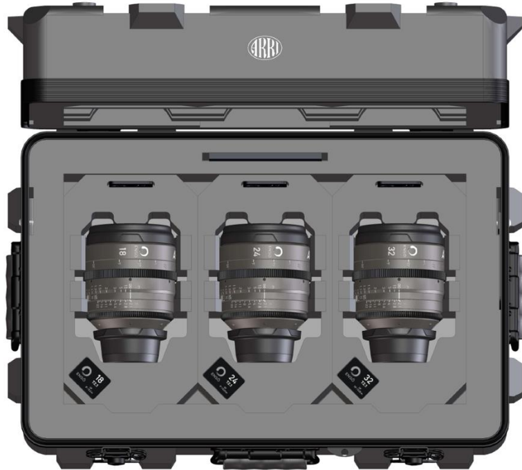
Ensō プライムレンズキット 18mm、24mm、32mm