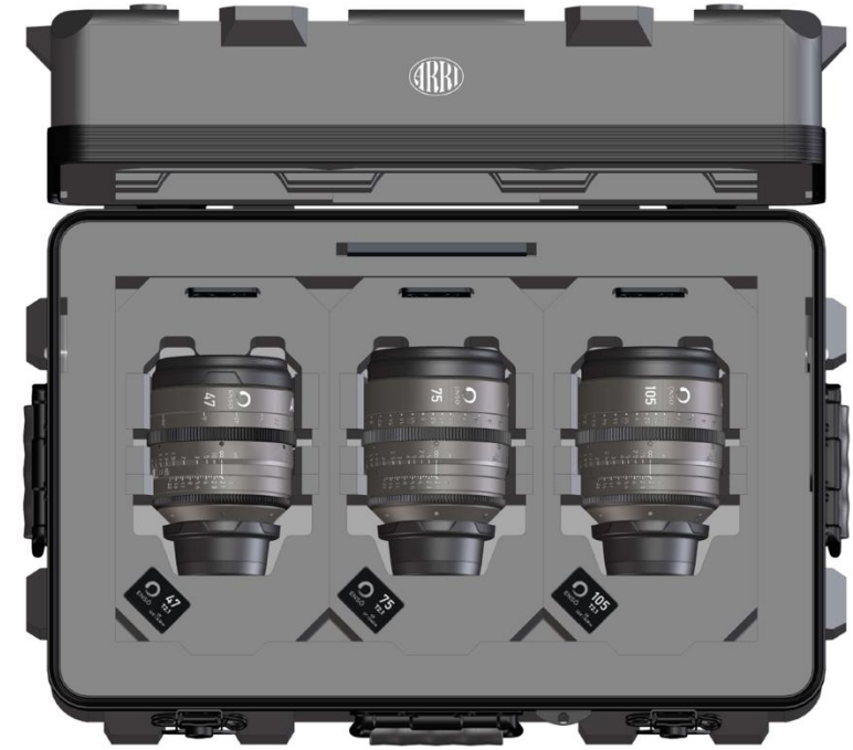
Ensō プライムレンズキット 47mm、75mm、105mm