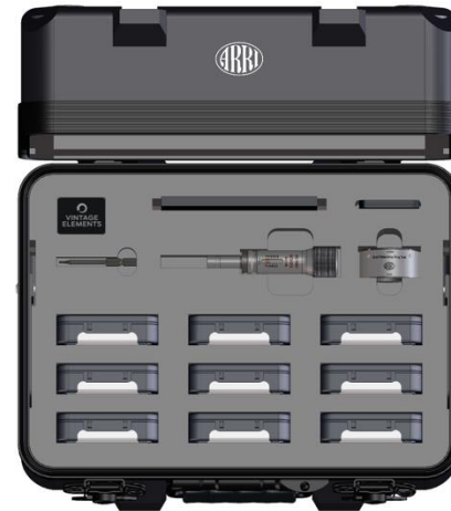
Ensō Vintage Elements キット